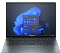
HP Dragonfly G4 5G